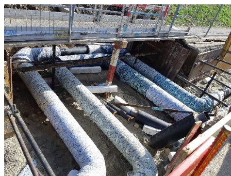
Coudes de dilatation à l'Avenue du Fey

La canalisation figurée en bleu clair sur l'extrait ci-dessus se situe par endroit sous les coudes de dilatation des conduites du réseau de chauffage à distance. Avec la température de l'eau qui circulera dans les conduites, l'existence de ces zones de dilatation à des distances régulières est obligatoire, ce qui implique une implantation des conduites très complexe à établir surtout lorsque d'autres tracés existent déjà.