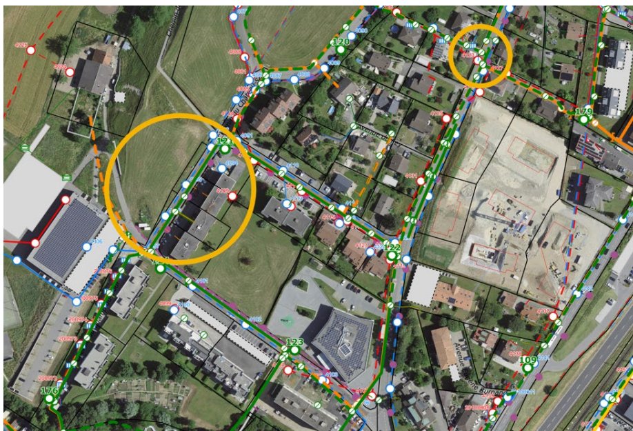
Figure 1 Plan de situation avec identification des deux zones