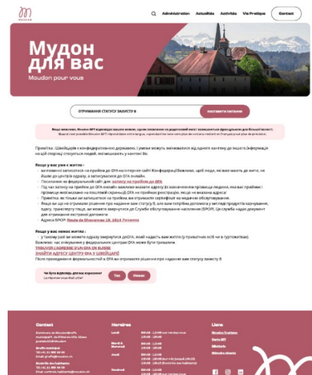
Figure 1 La question posée en ukrainien était "Obtenir le statut de protection B"

⇒ « Moudon GPT » - proposé en option, ce module d'intelligence artificielle sera intégré au site et aura accès à la base de données de la commune, permettant aux administrés de poser des questions et recevoir des réponses, plus fournies qu'en utilisant un moteur de recherche classique. L'atout majeur, outre le fait d'être disponible 24/7, est qu'il répond dans la langue de la question. Il ne sera donc pas nécessaire de traduire les pages en allemand, portugais, ou ukrainien. C'est un outil précieux pour augmenter l'engagement des citoyens tout en optimisant la diffusion de l'information. C'est également la touche novatrice attendue dans ce projet.